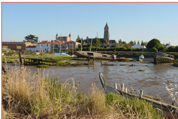
Chantier naval à Noirmoutier