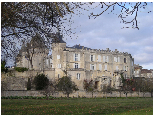
Château de Jonzac